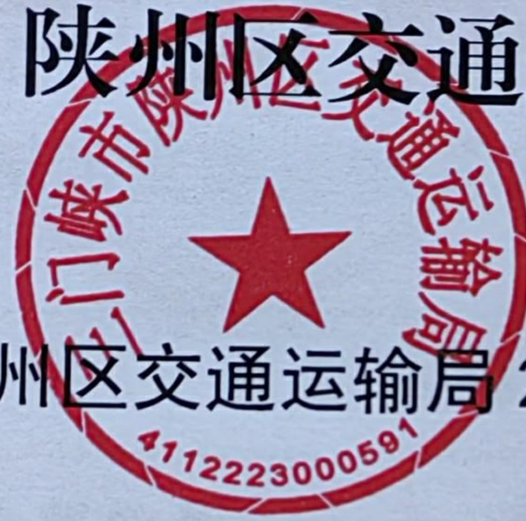
陕州区交通运输局 2024 年度行政处罚案件情况统计表