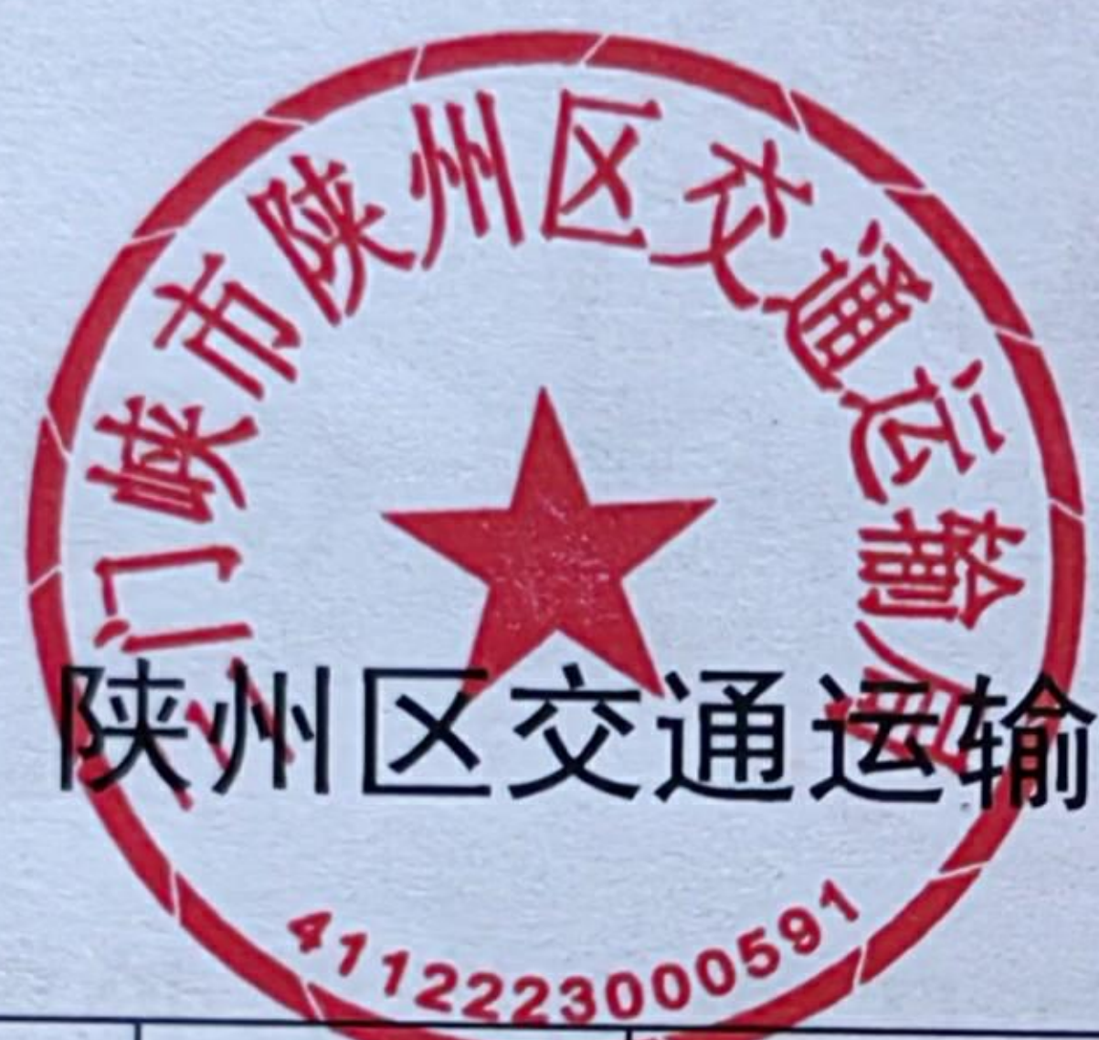
咸州区交通运输局 2024 年度其他行政执法行为案件情况统计表