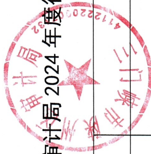
陕州区审计局 2024 年度行政强制案件情况统计表