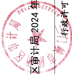
陕州区审计局 2024 年度行政许可案件情况统计表