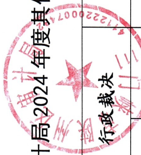
陕州区审计局2024年度其他行政执法行为案件情况统计表